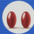
Rotwein-Extrakt, Kakao-Extrakt, Omega-3-Fettsäuren