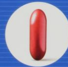
L-Carnitin, Coenzym Q 10