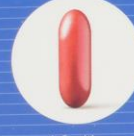
L-Carnitin, Coenzym Q 10 , Vitamin E